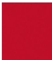
Velocity Red Mica (27A)